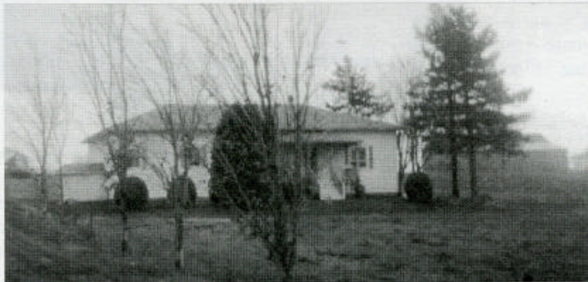
Nouvelle maison construite en 1956.