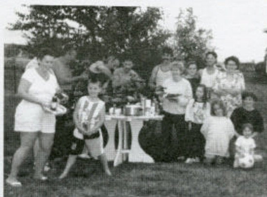
La famille réunie pour déguster cet excellent poulet.